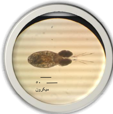
شکل ۲: پاروپای بالغ E. serrulatus ، دارای تخم (الف) و تخم ریخته (ب) ( \times 40 )

جدول ۱: مشخصات تیمارهای استفاده شده و دفعات تغذیه پارو پای E. serrulatus .