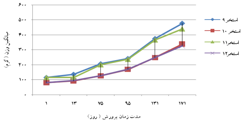
شکل ۳: تغییرات میانگین وزن ( \pm SD ) کفال خاکستری در سال دوم پرورش در تیمارهای مختلف