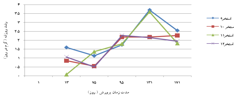
شکل ۴: تغییرات میزان رشد روزانه (گرم در روز) کفال خاکستری در سال دوم پرورش در تیمارهای مختلف

آب کلیه استخرها از یک منبع و کانال تامین شده و به دلیل یکنواختی در اندازه و شکل و ارتفاع آبیگری استخرهای پرورشی، دمای آب آنها در طول مدت پرورش یکسان بوده است. حداقل و حداکثر درجه حرارت آب کلیه استخرها به ترتیب ۸/۴ و ۲۸/۲ سانتی گراد در ماههای دی و تیر بود. دامنه درجه حرارت مناسب برای تغذیه ۲۰-۲۸ درجه سانتی گراد می باشد که این دامنه دمای آب در منطقه معمولاً در بین ماههای اوایل اردیبهشت تا اواخر مهر ماه مشاهده می شود. میزان حداقل و حداکثر شوری آب استخرها به ترتیب ۲۳.۳ و ۳۲ ppt بود. میزان حداقل و حداکثر شفافیت آب استخرها به ترتیب ۲۴ و ۵۰ سانتی متر در تیر ماه و بهمن بود. حداقل پی اچ در صبحها ۷/۶ و حداکثر آن در بعد از ظهر ۸/۸ بوده است. دامنه میزان اکسیژن محلول ثبت شده استخرها ۴.۵ - ۷.۶ میلی گرم در لیتر و این میزان برای BOD_5 ۱.۱۵ تا ۳.۲ میلی گرم در لیتر برآورد گردید. در مورد میزان