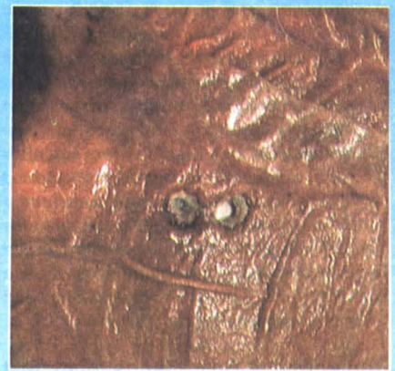
مورد ۱ (case of sheep)

یک گله مرغ مادر گوشتی ناگهان افت تولید تخم مرغ و تغییر رنگ پوسته تخم مرغ را چند روز بعد از مصرف دان جدیدی نشان داد (شکل بالا) و در روزهای بعد اندازه تخم مرغها نیز تغییر کرد. الف- عامل مسببه این مشکل چه می‌باشد؟ ب- چگونه این حالت پدید می‌آید؟ ج- چه مشکلی در ادامه این حالت در گله بروز می‌کند؟